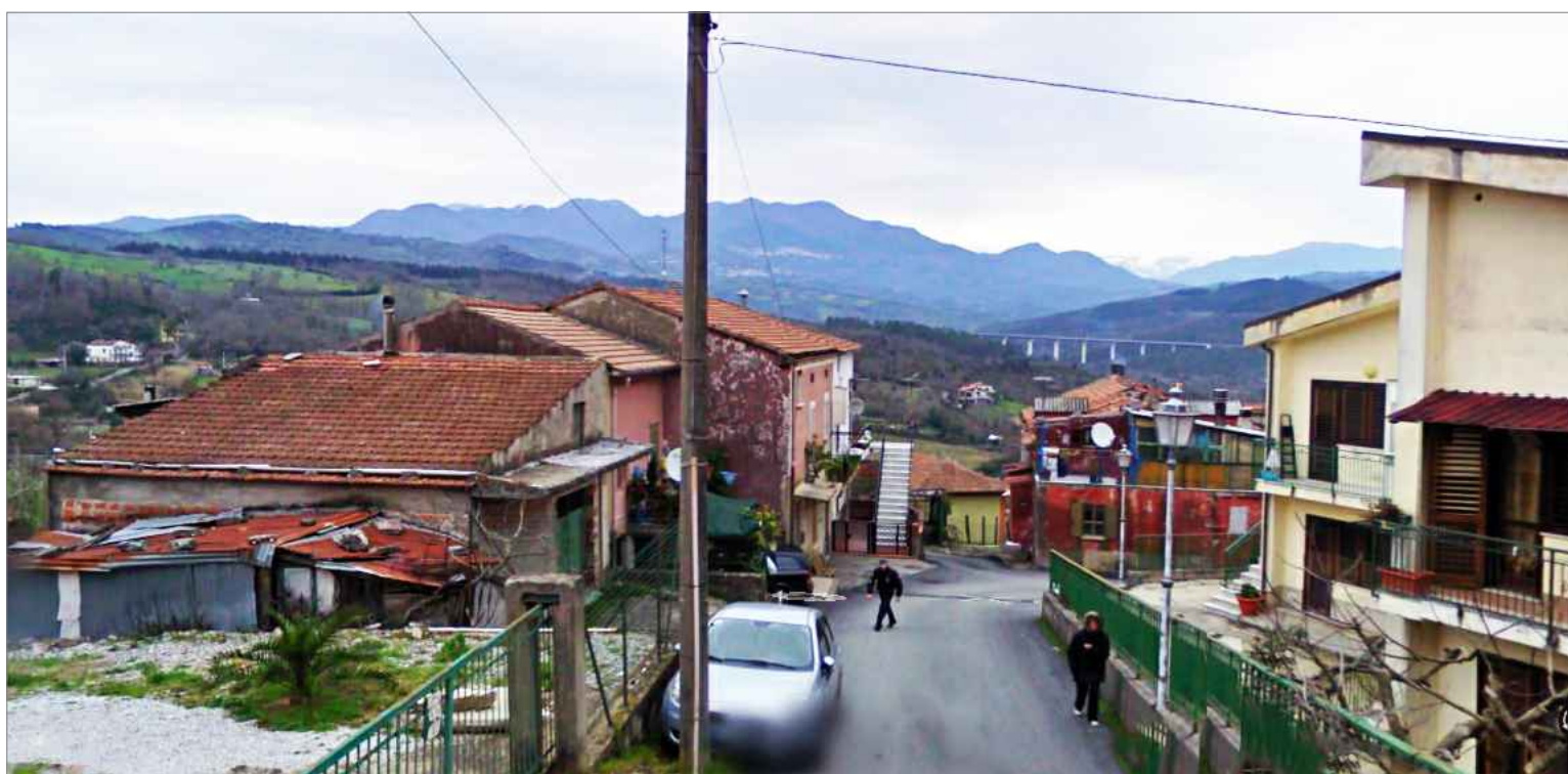
Punto di vista n. 1 ripristino corpi degradati