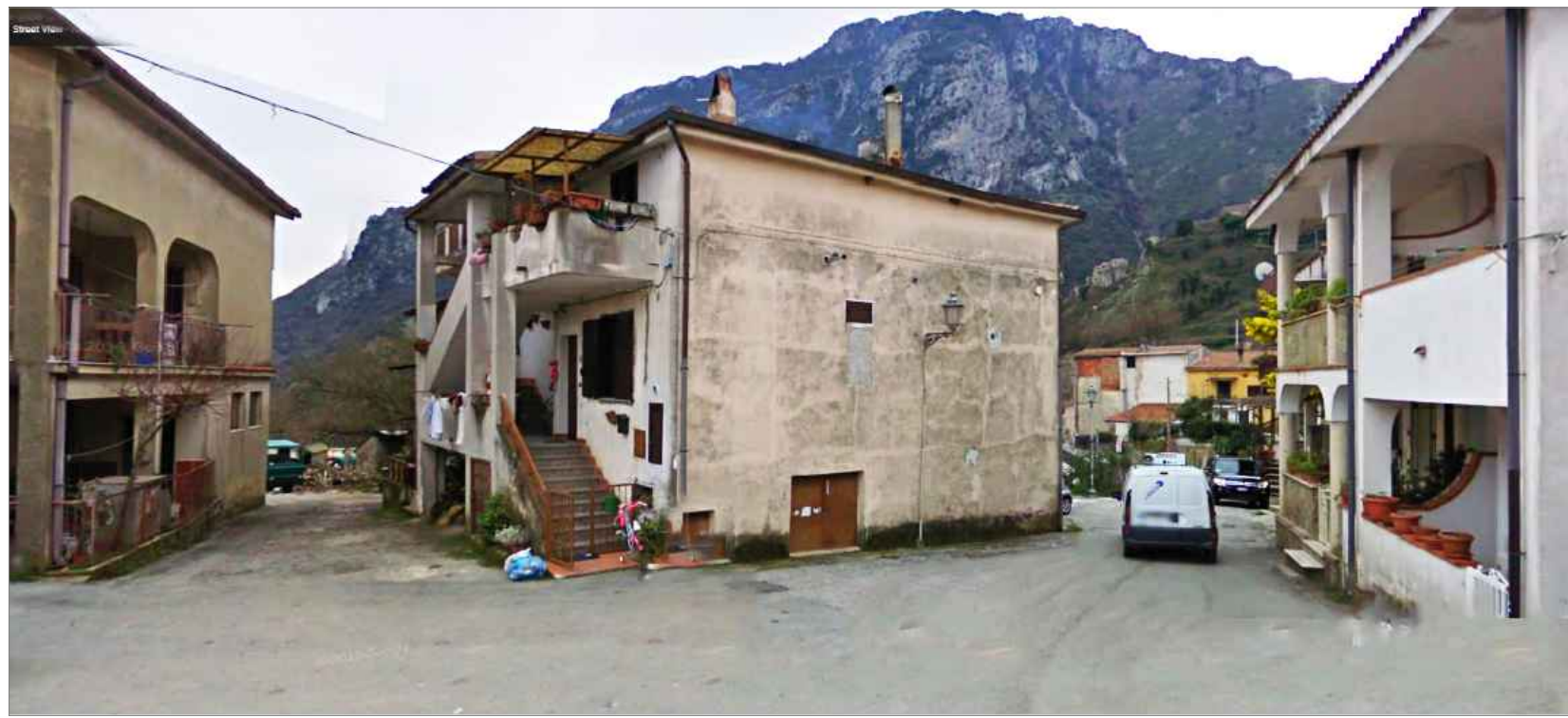
Punto di vista n.3 ripristino intonaco e pavimentazione