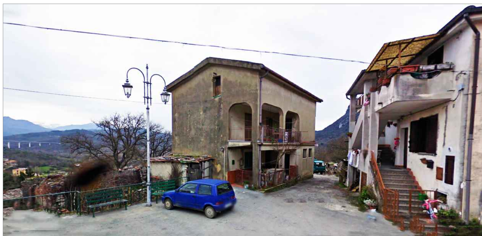
Punto di vista n. 2 ripristino intonaco e pavimentazione