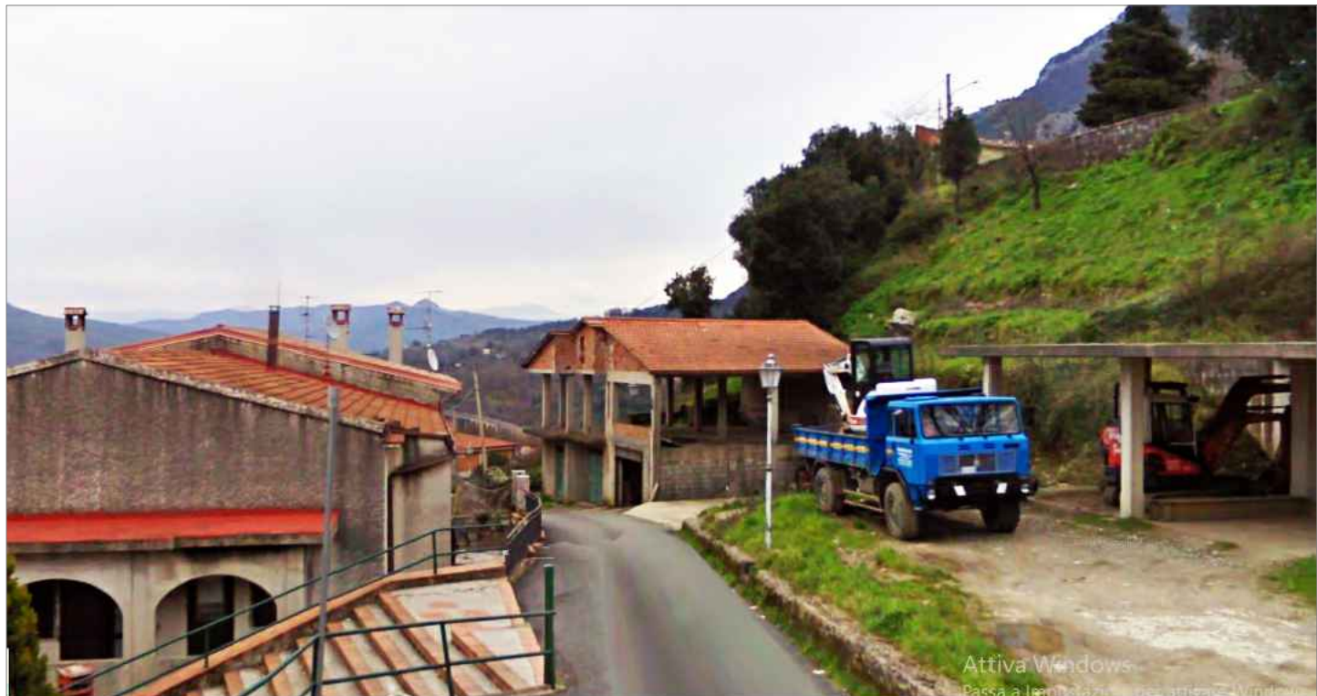
Punto di vista n.4 ripristino pavimentazione e cordolo parcheggio